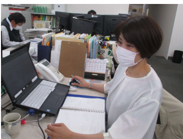
菊川品質環境管理室長