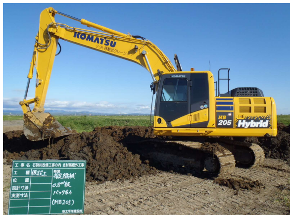
ハイブリット油圧ショベル