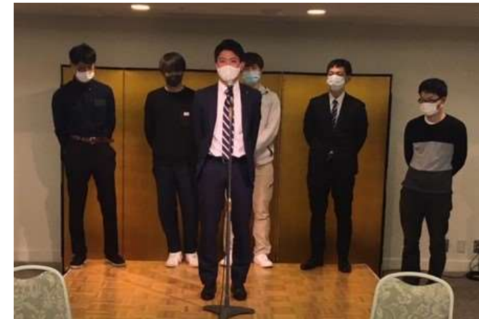
各現場毎の活動報告と意見交換会