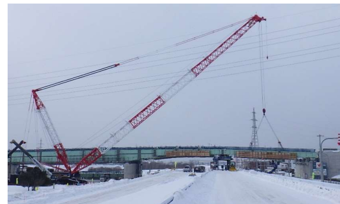
令和3年1月北24条大橋架設（札幌市）