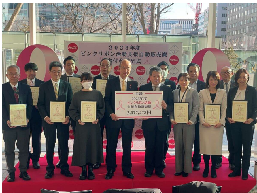
令和6年3月ピンクリボン活動の表彰式 (前列左から3番目が当社の法島副社長)