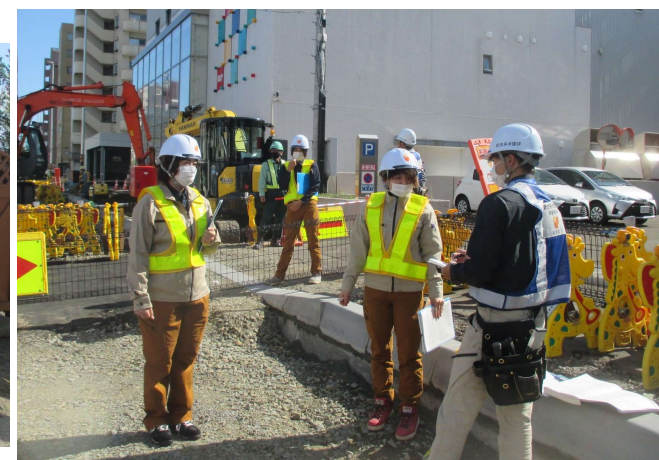
札幌市電線共同溝工事