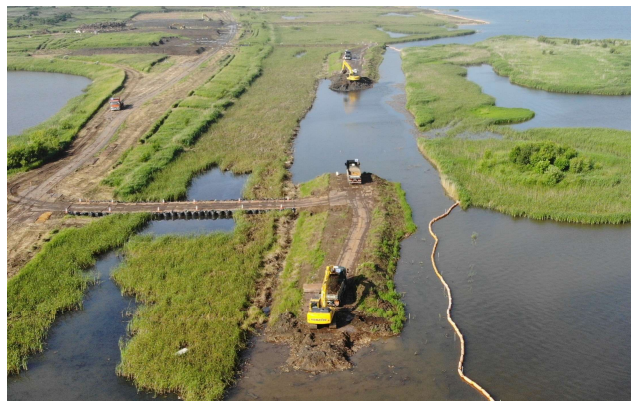
令和2年7月矢白場河道掘削（石狩川）

・令和2年度の河道掘削工事と橋梁新設工事で洪水対応タイムラインを、令和3年度の斜面对策工事で暴風雪対応タイムラインを、令和4年度の橋梁補修工事と令和6年度の豊平川河道整正工事で洪水対応タイムラインを実運用しました。