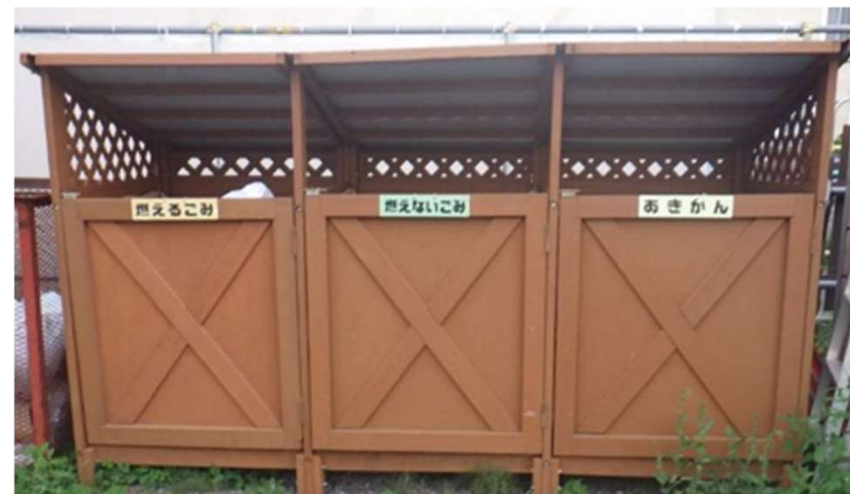
大型分別ゴミ箱の設置