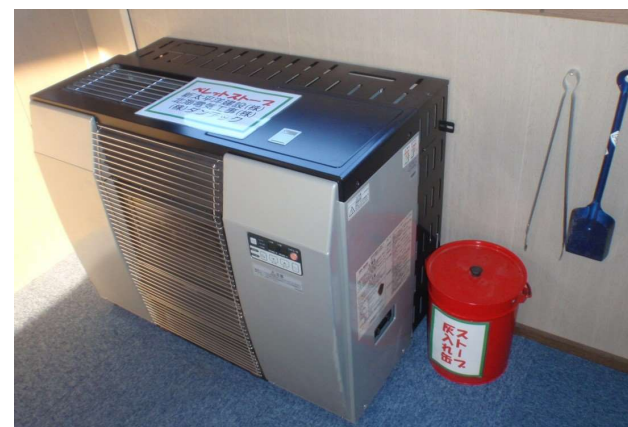
ペレットストーブ